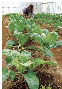
育成中の ブロッコリー