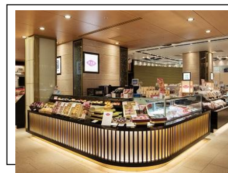
加工品販売ショップ(金沢駅あんと内)